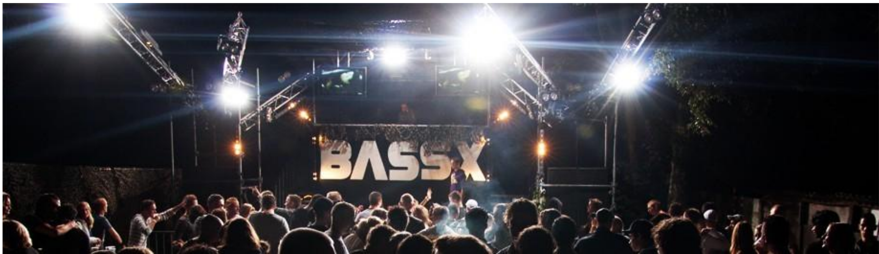
2 Bass-X 2009