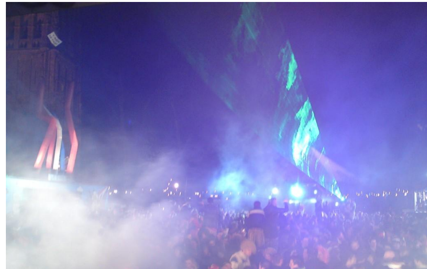
1Dollen Dinsdag 2010

Al jaren organiseren wij feesten in onze omgeving onder de naam Hilverhood. Dit is ondertussen een principe geworden in de regio. Dit gaat van kleine feesten in het jeugdcentrum die altijd afgeladen vol zitten met feestende mensen tot outdoor plein feesten waar meer dan 3.000 mensen op af komen. Op basis van non-profit weten wij tot nu toe nog alle feesten zonder entree kosten te organiseren. Dit betekent dus ook dat alle dj's die je in onze line-up ziet kosteloos altijd komen draaien. Deze kans die jullie bieden zou dan ook de ultieme manier zijn om voor deze Talenten iets terug te doen die onze feesten altijd tot een groot succes weten te leiden. Ook zijn wij er van overtuigd dat we met deze groep Talenten van Dj's en Producers de stage die jullie bieden op Q-Base volledig op zijn kop kunnen gaan zetten en ook hier een geweldig succes van kunnen maken.